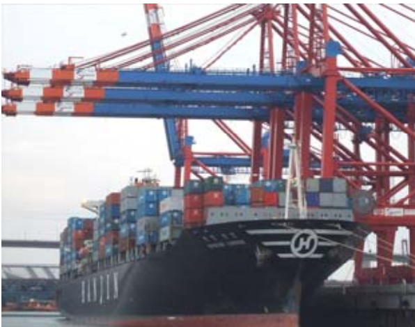
Der Hamburger Hafen als Logistikkreuzung

hälterreinigung und Logistikmanagement an. Die aktuelle weltweite Wirtschaftskrise stellt hohe Anforderungen an die Unternehmer und erfordert das Beschreiten neuer Wege. Wir bieten Ihnen mit unserer Veranstaltung neue Ideen und die Möglichkeit, sich in der Branche mit kompetenten Gesprächspartnern auszutauschen.