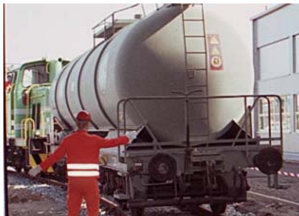
Der Kesselwagenreinigung und -reparatur wird bei der diesjährigen Veranstaltung ein besonderer Platz eingeräumt.

Melden Sie sich gleich an und nutzen Sie unseren Frühbucherrabatt.