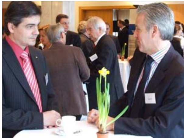
Wege aus der Krise - Stoff für interessante Gespräche.